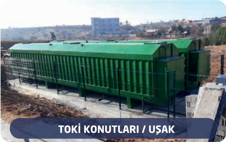
TOKİ KONUTLARI / UŞAK