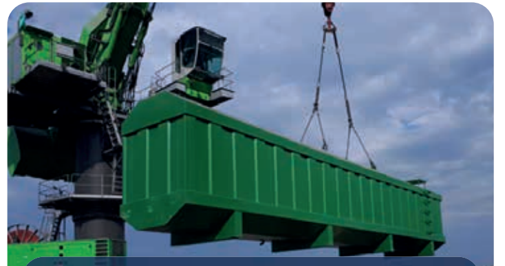
SUDAN SULTANLIĞI / ÖZEL KUVVETLER