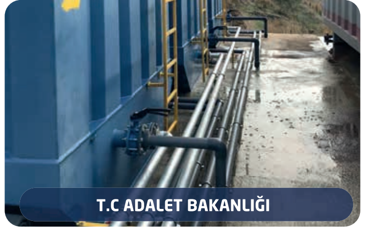
T.C ADALET BAKANLIĞI