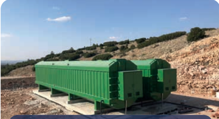
TOKİ KONUTLARI / DENİZLİ