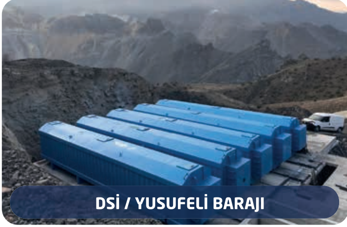
DSİ / YUSUFELİ BARAJI