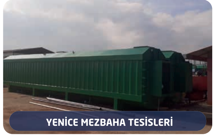
YENİCE MEZBAHA TESİSLERİ