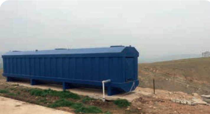
TOKİ KONUTLARI / SİİRT