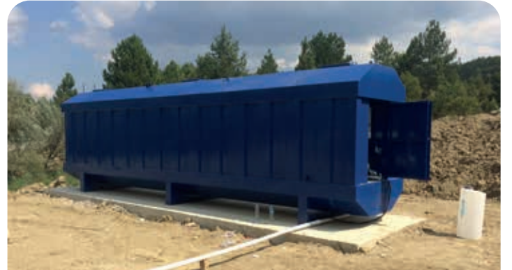
TOKİ KONUTLARI / KASTAMONU