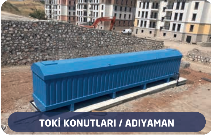
TOKİ KONUTLARI / ADIYAMAN