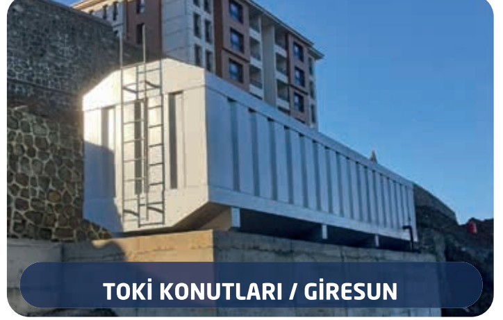
TOKİ KONUTLARI / GİRESUN