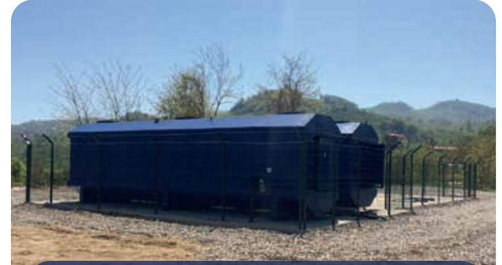
ORDU / ARICILIK ENSTİTÜSÜ