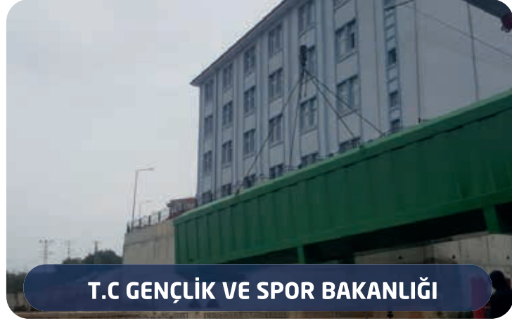
T.C GENÇLİK VE SPOR BAKANLIĞI