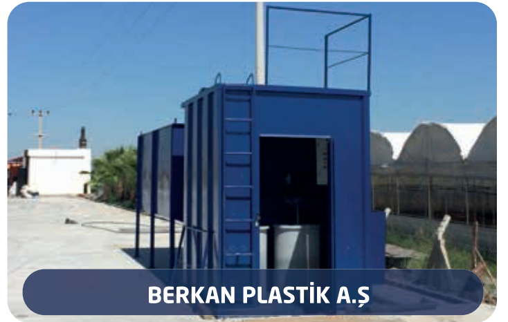
BERKAN PLASTİK A.Ş