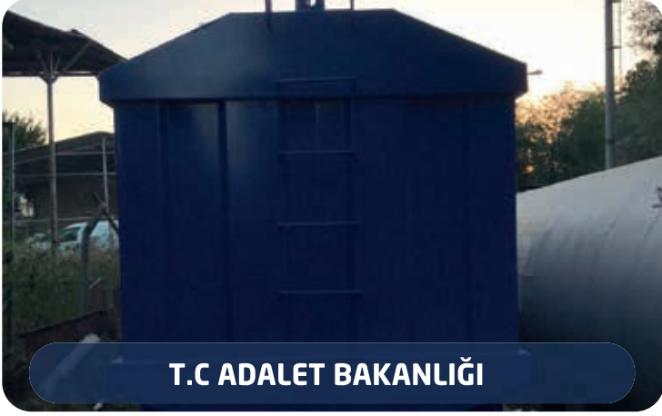
T.C ADALET BAKANLIĞI