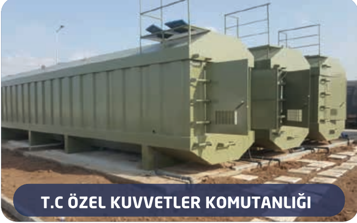
T.C ÖZEL KUVVETLER KOMUTANLIĞI