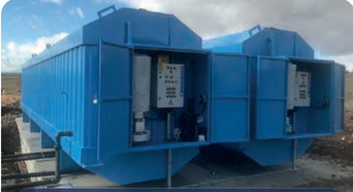
TOKİ KONUTLARI / AFYON