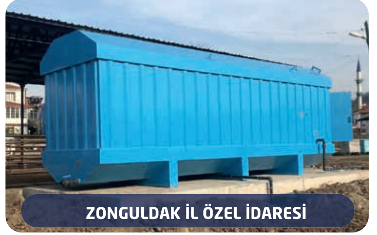
ZONGULDAK İL ÖZEL İDARESİ