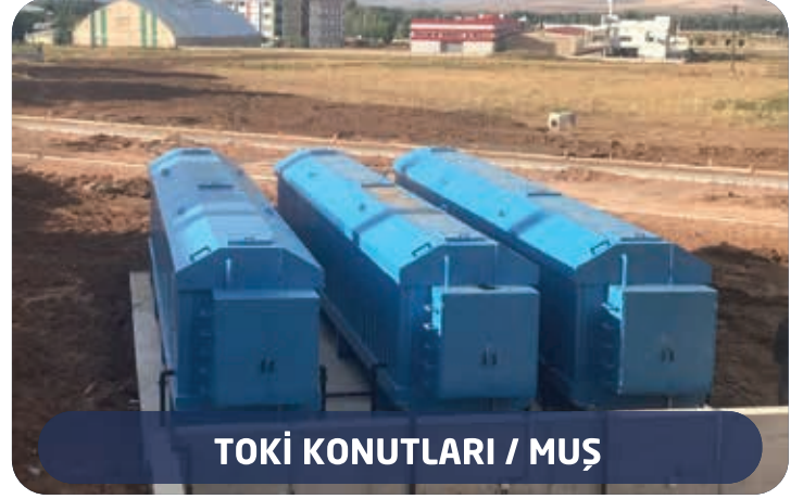
TOKİ KONUTLARI / MUŞ