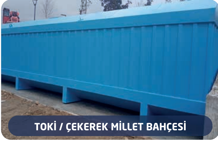
TOKİ / ÇEKEREK MİLLET BAHÇESİ