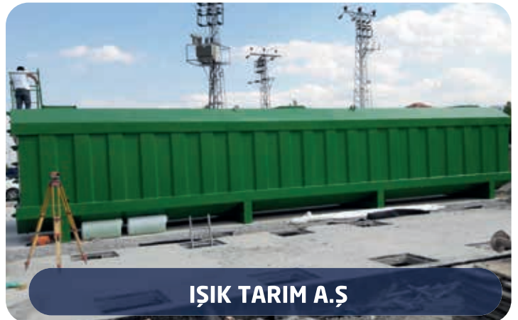
IŞIK TARIM A.Ş