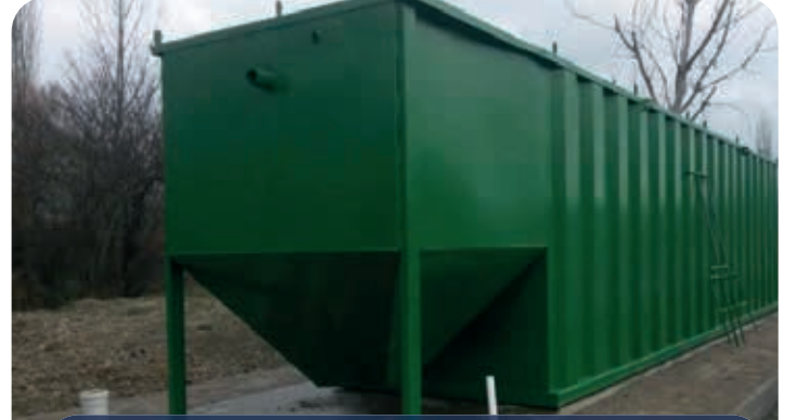
BUSKİ / 7 İLÇE PAKET AAT TESİSİ