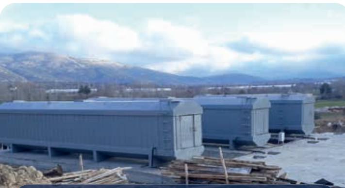
T.C GENÇLİK VE SPOR BAKANLIĞI